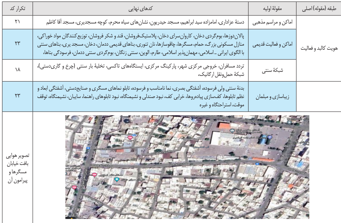
جدول ۱. مقوله هويت كالبد و فعاليت خيابان مسگرها

چالش هایی ریشه در کم توجهی گذشته داشته که اضمحلال محور را سبب ساز شده و فرسودگی آن را تسریع بخشیده است. بخشی از اقتصاد محلی مبتنی بر صنایع دستی در محور یاد شده به کیفیت محیطی برمی گردد که هر چه بالاتر باشد به همان اندازه پویایی کالبد اقتصاد محلی را رونق بخشیده و آن را ارتقا می دهد. ویژگی عناصر و بناهای موجود در محور و پیرامون آن ظرفیتی برای توسعه کالبدی است که توجه به آن ظرفیت اقتصاد محلی را بیشتر شکوفا خواهد کرد. جدول ۲ ظرفیت و چالش های مقوله خدمات و تسهیلات واحدهای صنفی صنایع دستی خيابان مسگرها را نشان می دهد.