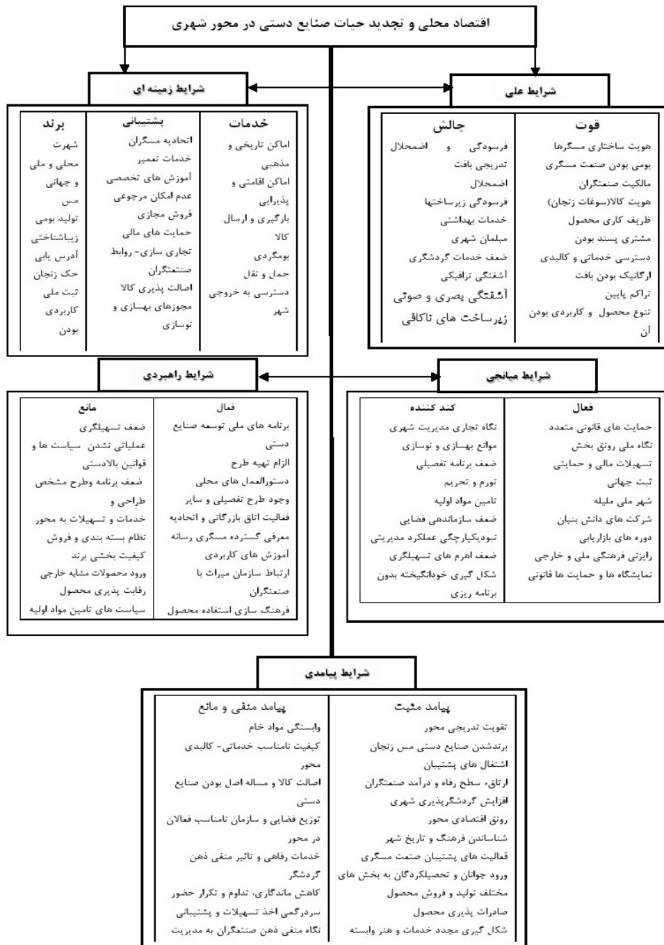
شکل ۳. مدل الگوواره‌های اقتصاد محلی مبتنی بر صنایع دستی در محورهای تاریخی شهر

جریان ترافیکی کنترل نشده، به چالش کشیده شدن برند مس زنجان با توجه به مسئله تشخیص اصالت کالا، سازمان و توزیع فضایی نامناسب فعالان صنایع دستی در طول محور مسگرها، کیفیت نامناسب نمای بناها و آشفتگی بصری آن، کاهش توان رقابت پذیری محصول با توجه به برنامه‌های بازاریابی رقیبان، احساس ناخوشایند گردشگران از کیفیت کالبدی، خدمات رفاهی و تسهیلات عمومی در محور مسگرها و خاطره ذهنی منفی گردشگر، در نتیجه کاهش ماندگاری، تداوم و تکرار حضور. سردرگمی تولیدکننده و فروشنده در