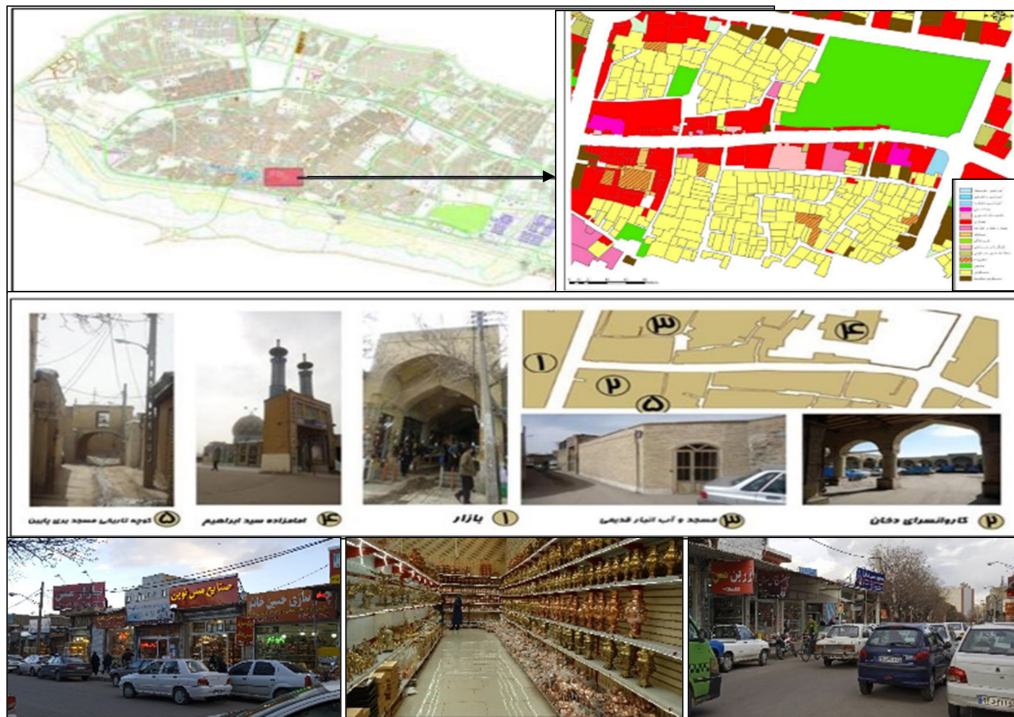
شکل ۲. موقعیت محدوده در شهر زنجان با عناصر مهم تاریخی- هویتی ظروف مسی محور مسگرها

می‌دهد گزینه‌هایی مانند بنای امامزاده، کارگاه‌های مسگری قدیمی، کاروان‌سراها، کارگاه‌های مسگری، کارگاه سفیدگری ظروف مسی، چکش‌زن‌های ظروف مسی، انبارهای ظروف مسی، چاقوسازها، تبر سازها، داس سازها، پالان‌دوزها، باربرهای ظروف مسی، چرخ‌دستی‌های ورودی شهر، بازار تاریخی، کاروان‌سرای دخان، حمام صدیقی اشاره داشتند که هر یک یادآور خاطره‌ای از هویت گذشته هستند. این مقوله نقطه آغازین شناخت مختصات اقتصادی محور است که نشان می‌دهد محور یادشده دارای کدام هویت تاریخی و سنتی بوده و این هویت چگونه شکل‌گیری و بازتجدید صنایع دستی با اهرم مس و مسگری را سبب‌ساز شده است. با نگاهی به گذشته تاریخی شهرها مشاهده می‌شود که عمدتاً بازارهای مرتبط با صنایع دستی در مبادی ورودی و خروجی شهرها و یا در خروجی و ورودی بازارهای اصلی شهر قرار داشته‌اند. مطالعه سازمان فضایی بازار تاریخی شهر زنجان نشان می‌دهد ورودی غربی بازار تاریخی نیز اختصاص به کارگاه‌های مسگری و آهنگری داشته که در حال حاضر تولید و فروش ظروف مسی در آنجا رونق دارد. در مبادی شرقی نیز که خروجی بازار تاریخی زنجان است همین فعالیت در خیابان مسگرها مشاهده می‌شود. هرچند در کنار بازار مسگرها سایر فعالیت مرتبط دیگر مانند چاقوسازی، گیوه‌بافی، گلیم‌بافی، چاروق‌دوزی، ملیله‌کاری و غیره نیز به چشم می‌خورد، ولی آنچه به این محور هویت کالبدی و فعالیت داده هویت مبتنی بر ظروف مسی و مسگری است. با توجه به مباحث مطرح‌شده، مقولات اولیه استخراج‌شده از کدگذاری و رسیدن به مقوله اصلی در جدول ۱ آمده است.