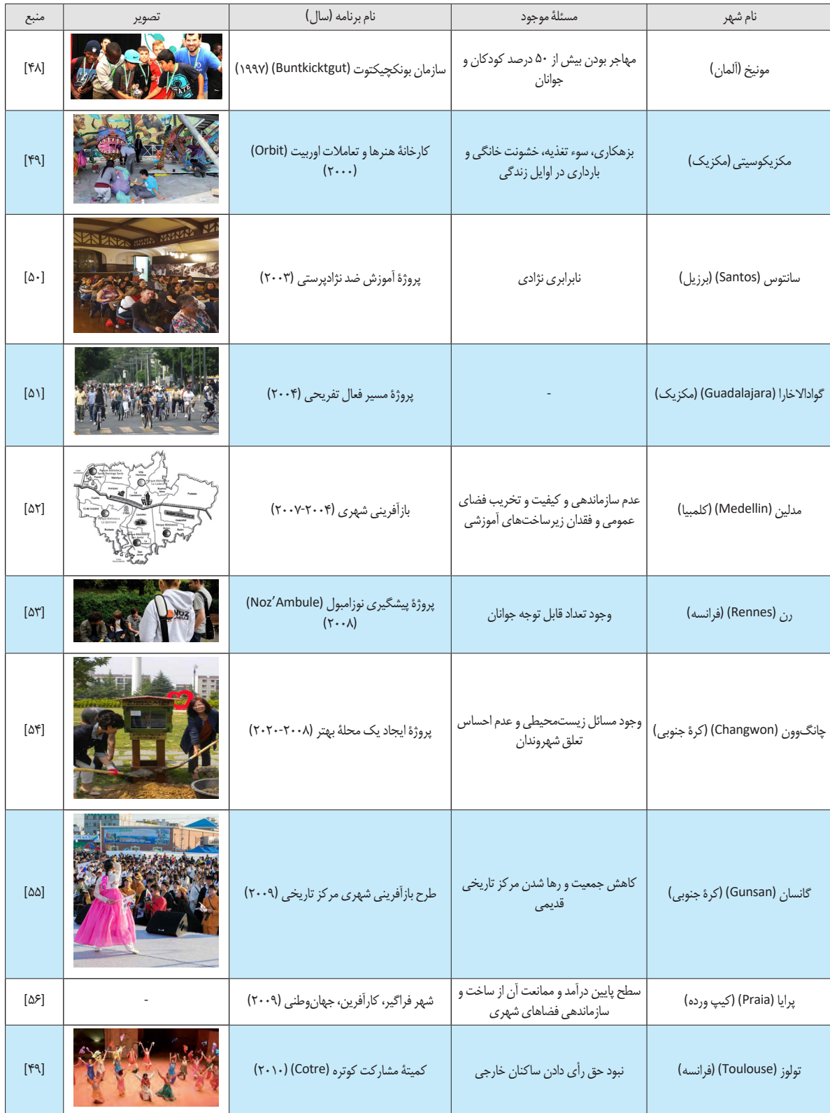
جدول ۱. معرفی تجارب جهانی از شهر آموزش دهنده در زمینه مؤلفه اجتماعی-فرهنگی