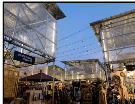
شکل ۲. بازارچه داداد در تایلند [۲۴]