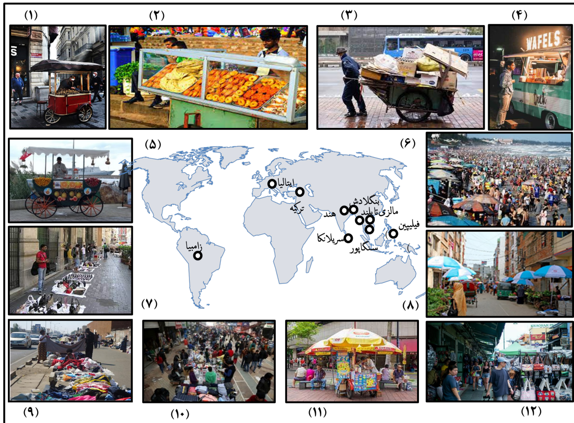
شکل ۱. نمونه‌ای از دست‌فروشی در کشورهای مختلف، (۱). ترکیه (استانبول)، (۲). سریلانکا، (۳). کره جنوبی، (۴). مالزی، (۵). ترکیه (ازمیر)، (۶). ویتنام، (۷). ایتالیا (۸). بنگلادش، (۹). زامبیا، (۱۰). هند، (۱۱). سنگاپور، (۱۲). تایلند، (۲۴)

مطالعه وضعیت دست‌فروشی در سایر کشورها، ارزیابی نحوه ساماندهی و نیز بررسی سازوکار، قوت‌ها و ضعف‌های آن، چشم‌اندازی را در اختیار محققان این حوزه قرار می‌دهد. در این پژوهش، به منظور پاسخ به اهداف تحقیق، به بررسی دست‌فروشی و نحوه ساماندهی آن در برخی از کشورها پرداخته شده