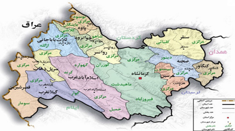
شکل ۱- نقشه و موقعیت جغرافیایی استان کرمانشاه