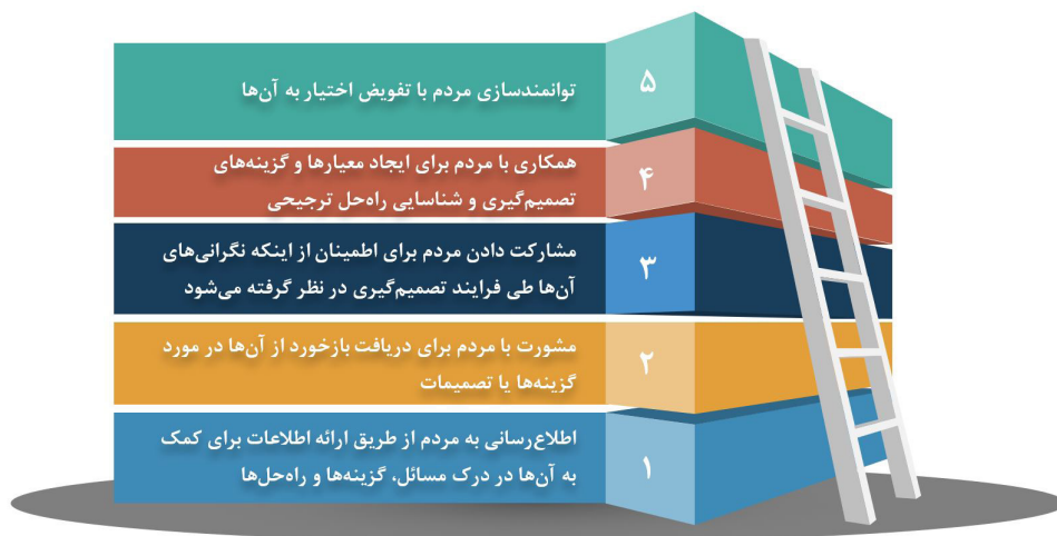
شکل ۲. سطوح مشارکت عمومی [۲۴]

- اعتقاد به ارزش مشارکت عمومی - آگاهی از اینکه دخیل شدن مردم، منجر به تصمیم‌گیری بهتر و مشارکت عمومی منجر به حکمرانی بهتر می‌شود؛ - ظرفیت مشارکت - حصول اطمینان از اینکه نهادها می‌دانند چگونه فرایندهای مشارکت عمومی را طراحی و اجرا کنند و سازمان‌ها و عموم مردم به طور نسبی دانش و مهارت‌های ارتباطی برای مشارکت مؤثر بر فرایند را دارند؛ - شفافیت کامل - به‌اشتراک‌گذاری به‌موقع اطلاعات و قابل درک بودن آن و دسترسی آسان به آموزش عمومی در مورد مسائل و گزینه‌ها؛ مشارکت عمومی باید به عنوان فرصتی برای اتخاذ یک تصمیم قدرتمند در نظر گرفته شود. تصمیمی که مسائل را با بیشترین رضایت ممکن و منافع طرف‌های ذی‌نفع حل می‌کند. هر چقدر زمان و تلاش بیشتری برای مشارکت عمومی صرف شود، سود بیشتری به همراه دارد و منجر به تصمیم قابل قبول‌تر، قابل اجرا تر و پایدارتر می‌شود.