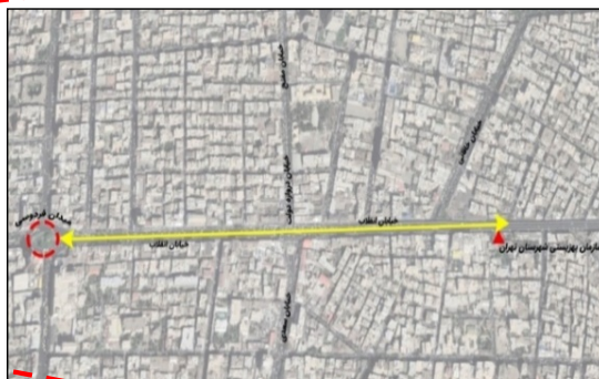
شکل ۴. موقعیت محور مطالعاتی

- مبلمان شهری مبلمان شهری یکی از عناصر مهم در فضاهای شهری است. مصالح به‌کاربرده‌شده در طراحی و ساخت این مبلمان برای استفاده شهروندان به‌خصوص افراد کم‌توان و ناتوان امر مهمی تلقی می‌شود. بر اساس مصاحبه‌های انجام‌شده با کارشناسان مشکلات افراد کم‌توان در ارتباط با شاخص مبلمان شهری یادشده، در جدول شماره ۸ آورده شده است. پس از بررسی‌های انجام‌شده می‌توان جدول سوات در ارتباط با هدف پژوهش را به‌صورت جدول ۹ و ۱۰ بیان کرد.