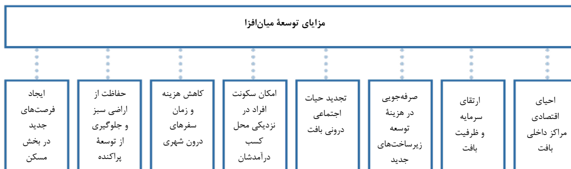
شکل ۲: مزایای توسعه میان‌افزا

مورد توجه قرار دهد. راه حل‌ها و مسائل مربوط به طراحی این گونه بناها، بر اساس ارزش‌ها و سنت‌های فرهنگی خاص منطقه تاریخی مورد نظر، نوع وضعیت ساختارهای موجود، میزان همگونی با محل و غیره متفاوت خواهد بود» (فیلدن و یوکیلتو، ۱۹۹۸).