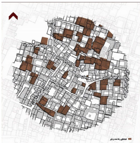
شکل ۴: زمین‌های فرسوده و بایر و رهاشده در محدوده مطالعه‌شده پژوهش