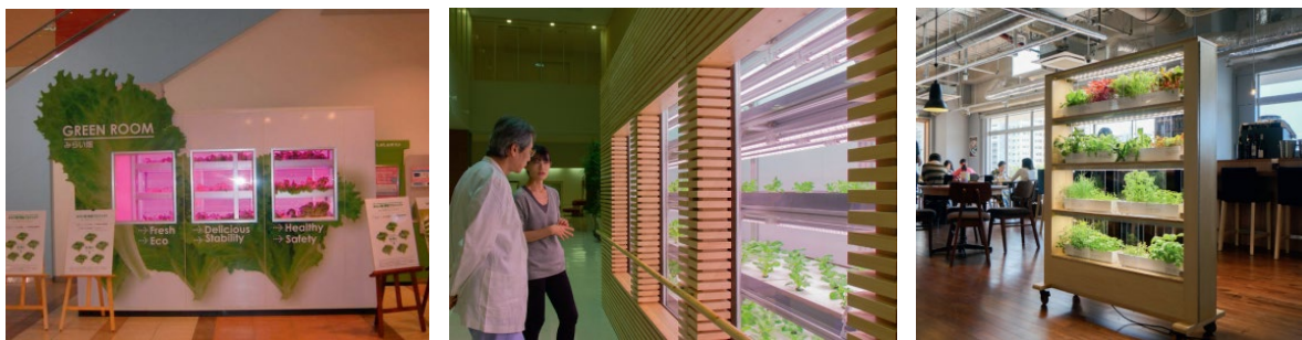
شکل ۱. به کارگیری گل‌خانه‌های کوچک با نور مصنوعی در رستوران‌ها، بیمارستان‌ها و مدرسه‌ها (کوزایا، ۲۰۱۲)

صنوعی و با شرایط محیطی کنترل‌شده برای رشد گیاه است. در شکل ۲، تصویری از سه نوع گل‌خانه تاریک رومیزی در لابراتوار مهندسی انرژی‌های تجدیدپذیر دانشگاه شهید بهشتی نشان داده شده است. مطابق شکل ۲، این سامانه دارای اجزای مختلف از جمله سازه، چراغ‌های ال‌ای‌دی رشد گیاه، سنسورهای اندازه‌گیری دما، رطوبت و شدت نور و واحد کنترل رشد است. هریک از این اجزا در ادامه توصیف شده است.