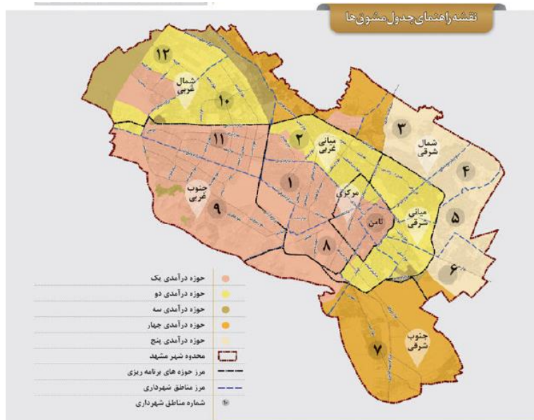
شکل ۱. نقشه راهنمای جدول مشوق‌ها در سرمایه‌گذاری مسکن در شهر مشهد

طرح اقدام ملی تولید مسکن براساس دستور رئیس‌جمهور به همه دستگاه‌های کشور مبنی بر اینکه باید همه زمین‌های مازاد در اختیار وزارت راه و شهرسازی برای تولید مسکن واگذار شود، با هدف بسترسازی و فراهم آوردن زمینه رونق تولید در حوزه مسکن و ساختمان و جبران تولید عقب‌ماندگی سال‌های گذشته برنامه‌ریزی آغاز شد. رونق اقتصادی، ایجاد و افزایش اشتغال در بخش‌های مرتبط از جمله صنعت، تولید و خدمات از دیگر اهداف اجرای این طرح در کشور معرفی شده است. علاوه بر موضوعات کلی یادشده، یکی از تجربیات خاص مرتبط در کشور ایران، به تجربه اخیر شهر مشهد بازمی‌گردد (شکل ۱). تهیه