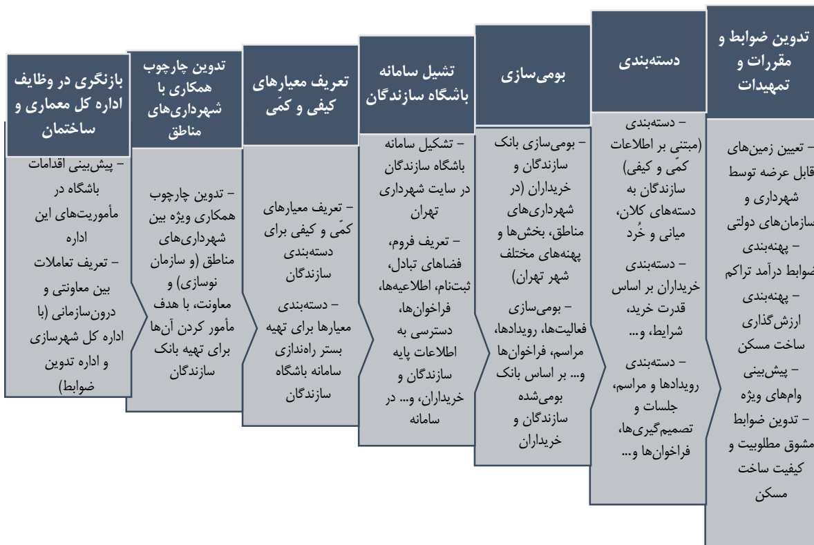
شکل ۴. فرایند پیشنهادی تشکیل باشگاه سازندگان

برخی بانک‌های اطلاعاتی معدود در شهرداری‌های مناطق در این خصوص وجود دارد، اما از دسته‌بندی و تعیین معیار لازم برخوردار نیست. از سوی دیگر، شناسنامه صرف برخی سازندگان، حاوی ویژگی‌های اتصال‌دهنده و وحدت‌بخش و قابلیت‌های سیاست‌گذاری در آن اندک است. از این رو، تشکیل باشگاه سازندگان مسکن، یک رویکرد جامع برای دستیابی به راه‌حل‌های سریع و در عین حال علمی رونق ساخت مسکن در شهر تهران را فراهم می‌سازد. به این منظور، باید در اقدامی اجباری، مشخصات دقیقی از سازندگان مسکن تهیه شود، نسبت به دسته‌بندی آن‌ها بر اساس صفات واقعی و توانایی‌های رشد مبادرت به عمل آید. این باشگاه، در عمل با سه هدف اساسی شکل گرفته و قابل گسترش خواهد بود: (۱) ایجاد پایگاه و بستر سازندگان قانونی شهر تهران، و دسته‌بندی کیفی و کمی آن‌ها، (۲) ایجاد محیط رقابتی برای ارتقای کارکرد سازندگان، (۳) قابلیت ارجاع سریع ساخت مسکن هدفمند با هدف رونق تولید مسکن. سازوکار این امر، معاونت معماری و شهرسازی، خود در تشکیل بانک اطلاعات سازندگان مسکن می‌تواند اقدام‌کننده باشد. دسته‌بندی سازندگان به سطوح مختلف (به طور مثال، خرد، میانی و یا کلان)، با همکاری شهرداری‌های مناطق، ایجاد فراخوان قانونی و یا ثبت‌نام آن‌لین، به عنوان یک پیش‌شرط برای ارائه امتیازهای خاص و واگذاری‌های ساخت