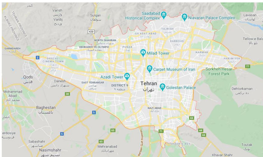
شکل ۲. محدوده مطالعه شده (شهر تهران)

و میانگین شدت تابش ۴/۵۸ کیلووات ساعت بر مترمربع گزینه مناسبی برای استفاده از انرژی خورشیدی محسوب می شود (حیدرزاده و همکاران، ۲۰۱۳). شکل ۲ نقشه ساده‌ای از محدوده مطالعاتی را نشان می دهد.