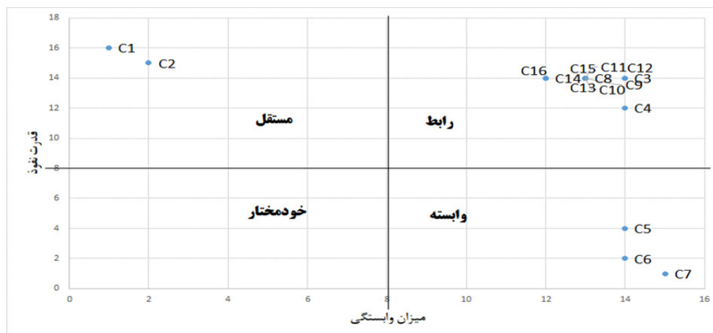
شکل ۲. ماتریس قدرت نفوذ-وابستگی

وجه تمایز این تحقیق با تحقیق حاضر است. تحقیق [۲۰] از آنجا که به شاخصه‌های شهر هوشمند توجه دارد مشابه با تحقیق حاضر است، اما نتایج این تحقیق عمدتاً کلی بوده و همانند تحقیق حاضر وارد جزئیات و دسته‌بندی عوامل فنی نمی‌شود.