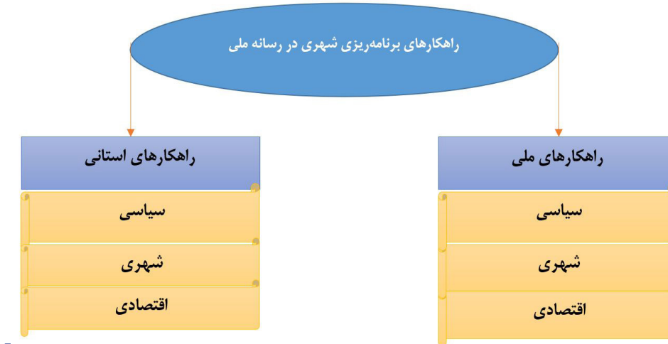
شکل ۱. دسته‌بندی راهکارهای افزایش مشارکت اقوام در فرهنگ قومی

دسته‌بندی راهکارهای برنامه‌ریزی شهری در رسانه