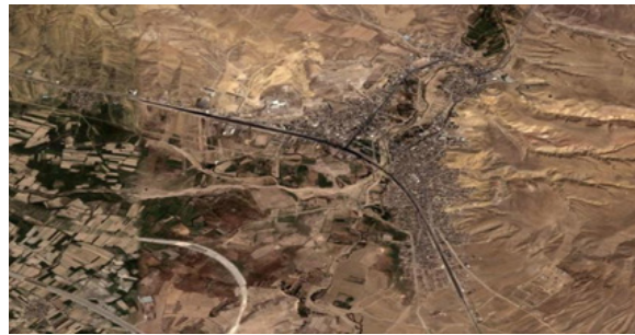
شکل ۲. نقشه هوایی شهر بستان آباد [۳۰].